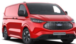
Race Red nemetalická