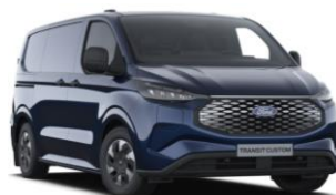
Blazer Blue nemetalická