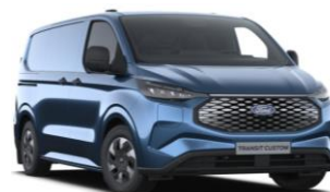
Blue Metallic metalická