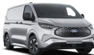
Moondust Silver metalická