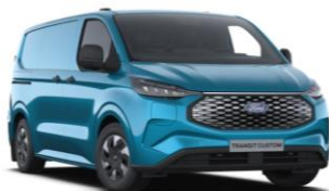
Digital Aqua Blue metalická