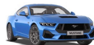
Grabber Blue Metalická