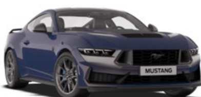
Blue Ember Metalická