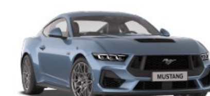
Vapor Blue Metalická