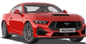
Race Red Nemetalická