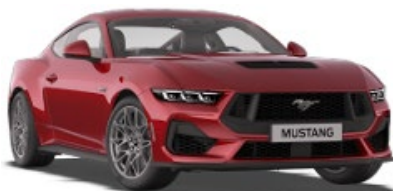
Lucid Red Nemetalická