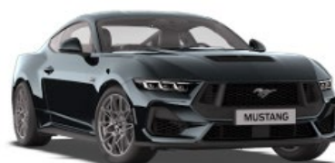
Dark Matter Gray Metalická