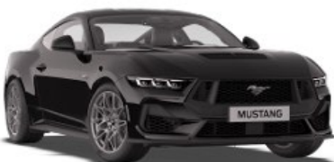
Absolute Black Metalická