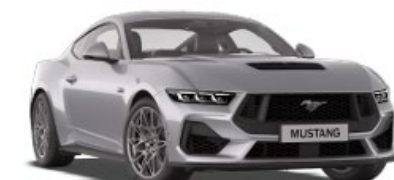
Iconic Silver Nemetalická