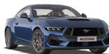
Atlas Blue Metalická