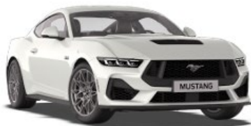
Oxford White Nemetalická