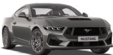
Carbonized Grey Nemetalická