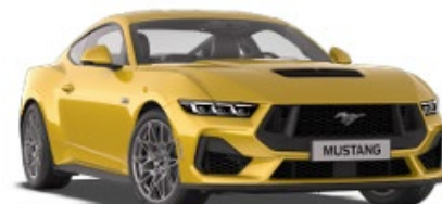
Yellow Splash Metalická