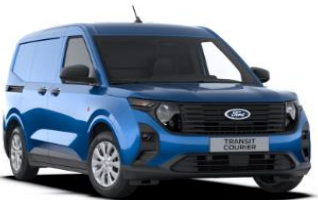
Desert Island blue Metalická