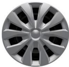
15" oceľové disky s krytmi kolies séria