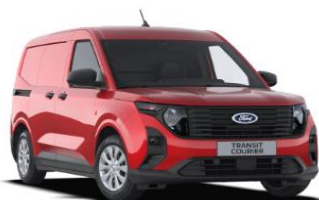
Fantastic Red Metalická