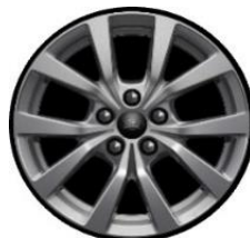
16" Sparkle Silver -zliatinové D2XCH