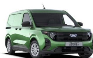
Bursting Green Metalická