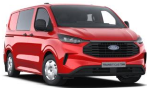
Race Red nemetalická