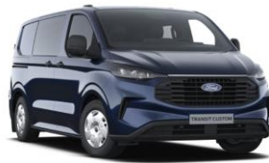
Blazer Blue nemetalická