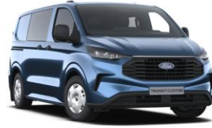
Blue Metallic metalická