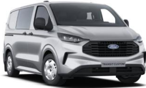
Moondust Silver metalická