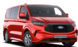
Artisan Red metalická