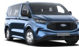
Blue Metallic metalická