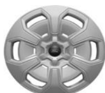
16" oceľové disky s krytmi