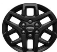
16" matné Black