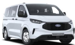
Frozen White nemetalická