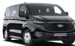
Agate Black metalická