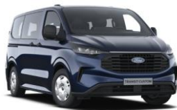
Blazer Blue nemetalická