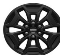
17" matné Magnetic