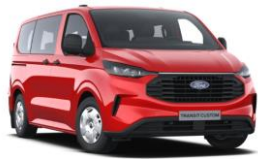
Race Red nemetalická