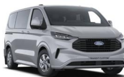
Grey Matter prémiová nemetalická