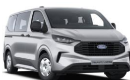
Moondust Silver metalická