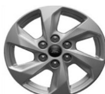
16" Sparkle Silver