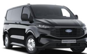
Agate Black metalická