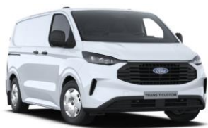
Frozen White nemetalická