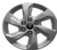
16" Sparkle Silver voliteľne Trend