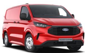
Race Red nemetalická