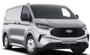
Moondust Silver metalická