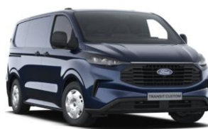
Blazer Blue nemetalická