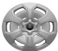
16" oceľové disky s krytmi séria Trend