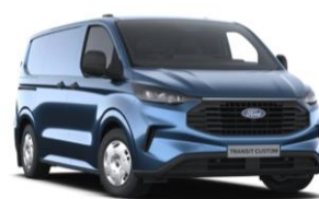
Blue Metallic metalická