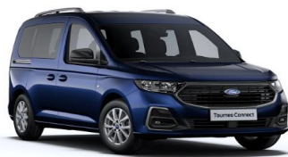
Midnight Blue Metalická