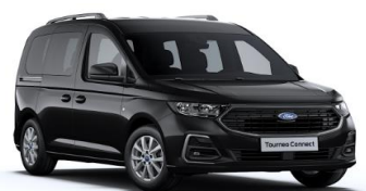
Intense Black Metalická