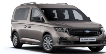
Dusky silver Metalická