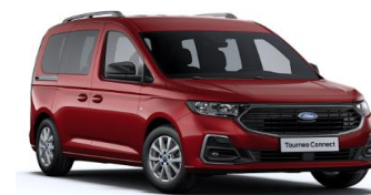
Red Maple Metalická