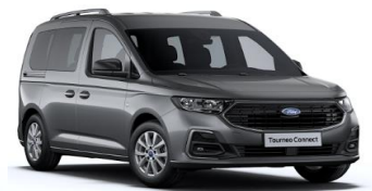
Graphite Grey Metalická