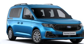
Boundless Blue Metalická