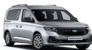
Stardust Silver Metalická