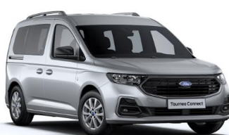
Stardust Silver Metalická