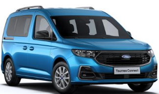
Boundless Blue Metalická