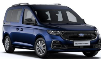
Midnight Blue Metalická