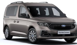
Dusky silver Metalická