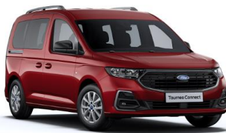
Red Maple Metalická