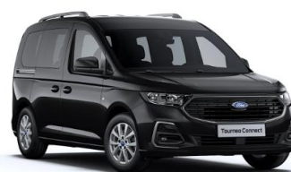
Intense Black Metalická