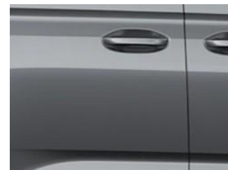
Graphite Grey Metalická