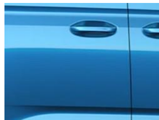
Boundless Blue Metalická