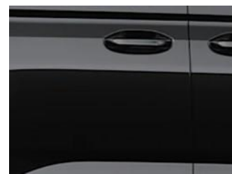
Intense Black Metalická