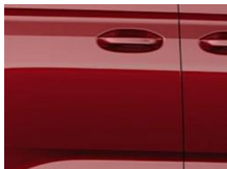
Red Maple Metalická