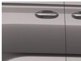
Dusky silver Metalická