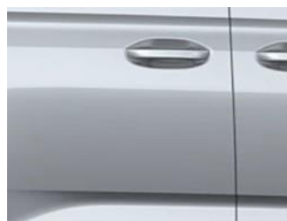
Stardust Silver Metalická