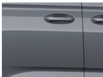
Steel Grey Nemetalická