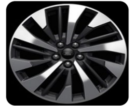
18" x 7.5" voliteľná výbava pre Titanium