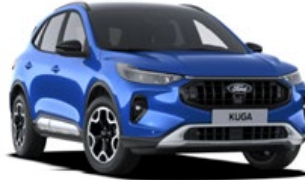
Desert Island blue