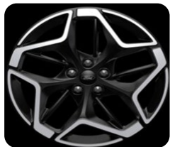
19" x 7.5" voliteľná výbava pre ST-Line a ST-Line X