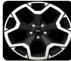
19" x 7.5" sériová výbava pre Active a Active X