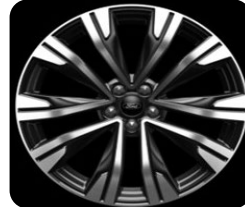
20" x 8.0" voliteľná výbava pre ST-Line X a Active X