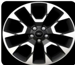
19" x 7.5" voliteľná výbava pre Active a Active X