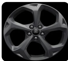
18" x 7.5" sériová výbava pre ST-Line a ST-Line X