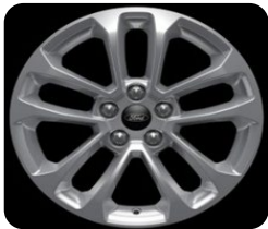
17" x 7.0" sériová výbava pre Titanium