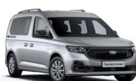
Stardust Silver Metalická