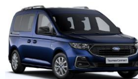
Midnight Blue Metalická