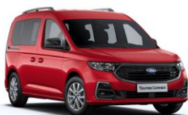
Lava Red Nemetalická