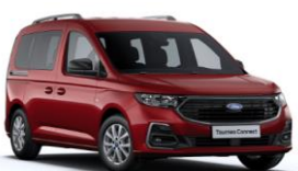
Red Maple Metalická