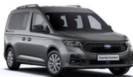
Graphite Grey Metalická