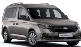
Dusky silver Metalická