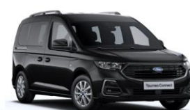
Intense Black Metalická