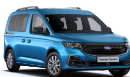
Boundless Blue Metalická