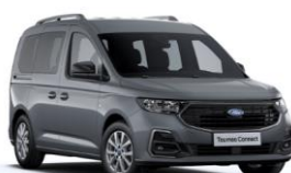
Steel Grey Nemetalická